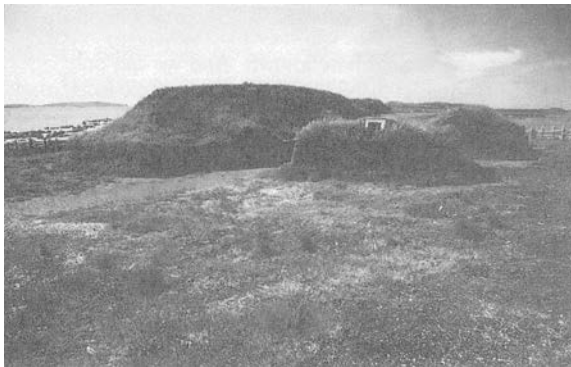
Л'Анс-о-Медовс, бухта Епав, північно-східний вершечок Ньюфаундленду: перше давньоскандинавське поселення наразі знайдене в Північній Америці. Тут під час розкопок 1961 і 1968 рр., які проводили сім археологічних експедицій, виявили вісім місць домівок вікінгів, які датують приблизно 1000 р. н. е.

Ці контакти здійснювали під час фази потепління, яка тривала впродовж двох сторіч. Імовірно, саме погіршення клімату змусило давніх скандинавів полишити місцевість. Новий контакт європейців із канадцами відбувся аж через п'ятсот років після Лейфа Ерикссона – 1497 року внаслідок мандрівки Джона Кабота, яку він розпочав із Бристоля, що в Англії. Знову ж таки, є легенди про ймовірні давніші мандрівки, але навіть якщо Каботова подорож була не першою, вона, безумовно, мала наслідки. Той вояж був елементом вибухової морської експансії XV сторіччя, завдяки якій європейці до 1520 року змогли обійти довкола світу. Кабот (уроджений Джованні Кабото), як і його