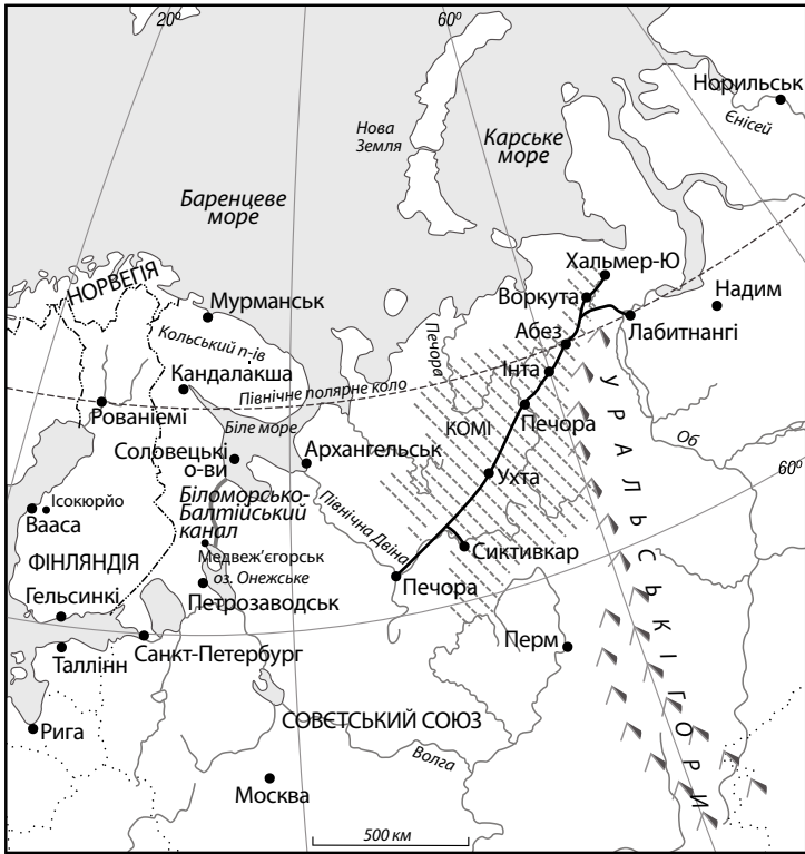
Північна частина Фінляндії та СРСР у 1950-х роках.

На карті позначено залізницю, прокладену від Котласу до Воркути і далі, уздовж якої функціонувало чимало таборів примусової праці