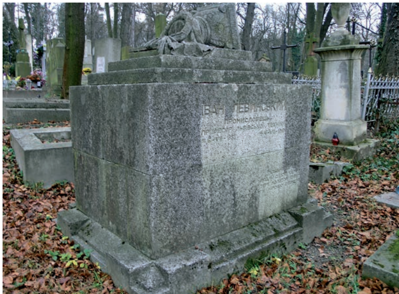
Надгробок на могилі І. Левинського. Сучасне фото

ки , 103; від 1913 – монастир василіанок , тепер Національний лісотехнічний університет України ), гімназії ім. Володимира Великого у Рогатині (1911–1912, тепер Колегіум Національного університету “ Києво-Могилянська академія ”).