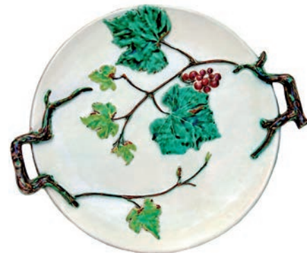
Декоративна тарілка. Фабрика майоліки І. Левинського . Поч. XX ст.

ЛЕВИНСЬКИЙ ЛЕВ (07.09.1876 – бл. 1940) – архітектор. Небіж І. Левинського , син управителя його фабрики Лева Левинського-старшого . Народився у с. Демня Вижня (тепер в складі м. Сколе Львівської обл. ). Вчився на архітектурно-