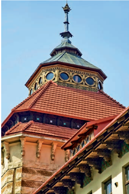
Вежа будинку колишньої гімназії та бурси Українського педагогічного товариства на вул. Генерала Чупринки, 105. Сучасне фото