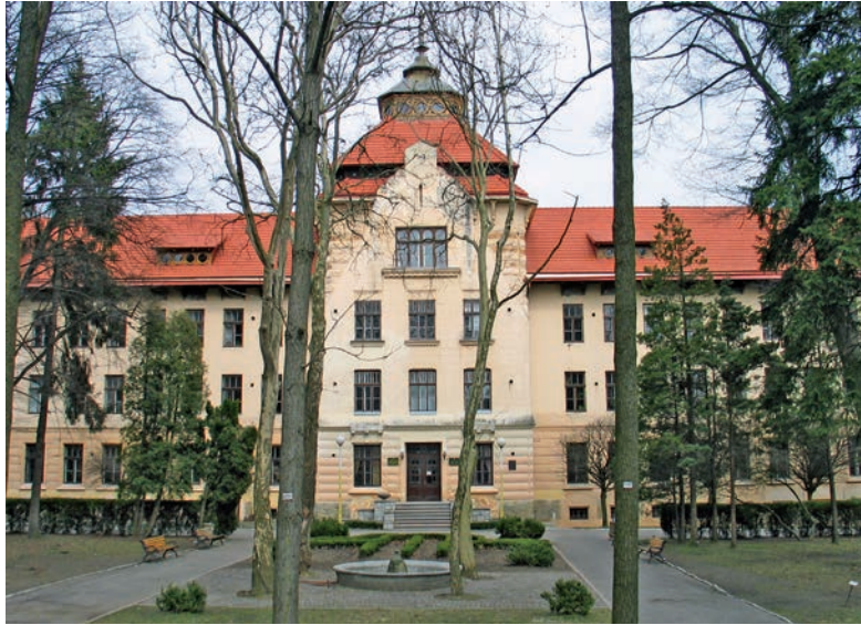
Гімназія та бурса Українського педагогічного товариства (тепер Національний лісотехнічний університет України). 1906–1908 рр. Архітектор Л. Левинський у співавторстві. Сучасне фото

му відділі Львівської Політехніки (1897–1903). Після отримання диплома працював в архітектурно-проектному бюро І. Левинського.