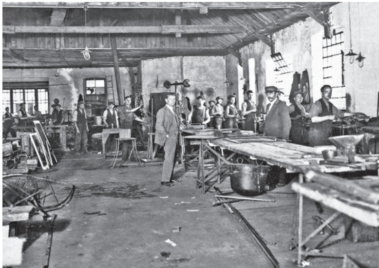
Цех фабрики І. Левинського. Фото поч. XX ст.

1889–1890), будинки на вул. Набеляка (тепер вул. І. Котляревського), 27–29–31 і 37 (1890–1891) – усі збереглися в перебудованому вигляді. Імовірно, бл. 1899–1900 було запроєктовано і споруджено віллу К. Дзядоня-Дзелінського на вул. Генерала Чупринки, 21 (імовірно, проєкт фірми Л. або М. Ковальчука). Цікавою була вілла-майстерня А. Попеля, споруджена 1902 за виконанням у бюро Л. проєктом В. Годовського на вул. І. Горбачевського, 6 (нині не існує). 1906 фірма Л. спорудила новий будинок Академічної гімназії на вул. Л. Сапіги (тепер вул. С. Бандери), 14; на поч. XX ст. – лікарні у Львові, Ворохті, Косові, Коломиї, Золочеві.