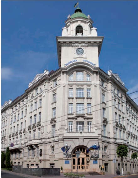
Будинок Дирекції залізниці. 1912–1913 рр. Архітектор З. Б. Левинський. Сучасне фото