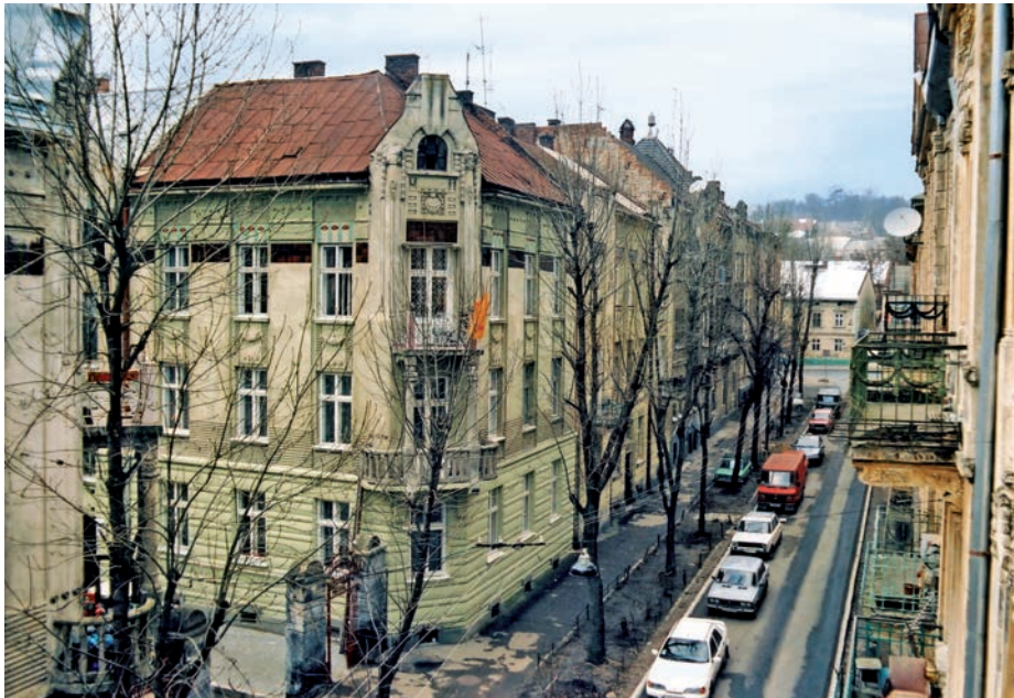
Будинок на вул. Д. Донцова, 8. Сучасне фото

музичного інституту ім. М. Лисенка на пл. М. Шашкевича, 5 (1913–1916, проєкт Є. Червинського). Українська сецесія яскраво домінує тут в інтер'єрах зі стінними розписами М. Сосенка . 1912 для Р. Ковшевича фірма Л. спорудила віллу – один із найкращих прикладів “раціонального” модерну; водночас у цій будівлі збережена й декоративність.