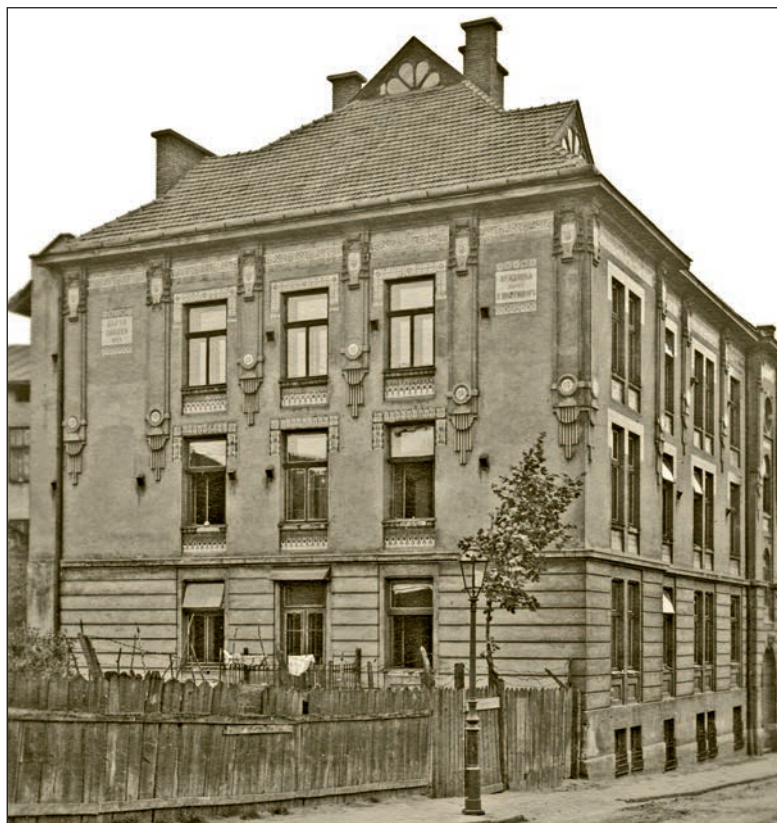
Бурса дяків собору св. Юра. 1903–1904 рр. Тепер вул. Є. Озаркевича , 2. Архівне фото