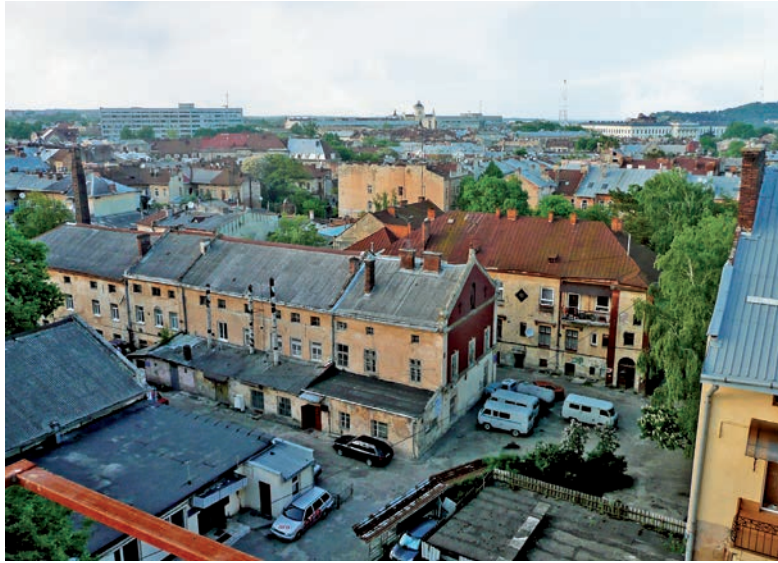
Будинки колишньої фабрики І. Левинського на вул. Генерала Чупринки, 58а. Сучасне фото

вул. Друкарській, 3 і 4; 1897–1898) і стиль неоготики (вілла Г. Бромільської, тепер вул. С. Коновальця, 27; проєкт С. Маєрського, 1898–1899).